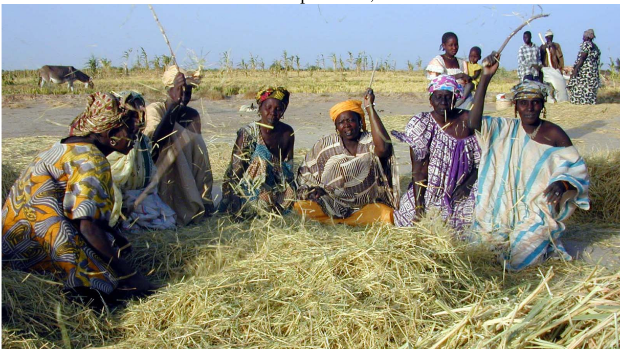
Bild 5: Beim Dreschen wird mit langen Stöcken auf das Korn eingeschlagen.

Der Transport der Ähren vom Feld zum Dreschplatz, das Dreschen und das Würfeln sind Frauensache. Die Reissäcke zu füllen und zuzunähen und die Säcke auf Eselrücken ins Dorf abzutransportieren, ist Männerarbeit.