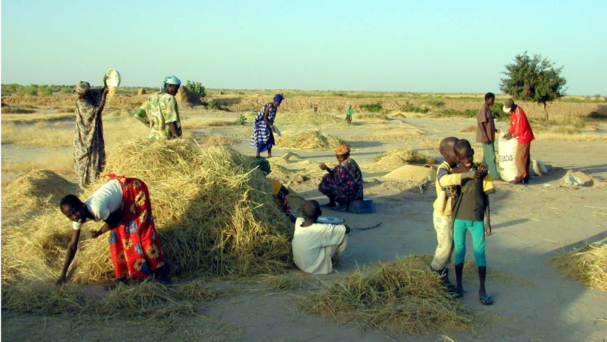
Bild 6: Beim Wörfeln schütten die Frauen den Reis in den Wind, um die Spreu vom Korn zu trennen