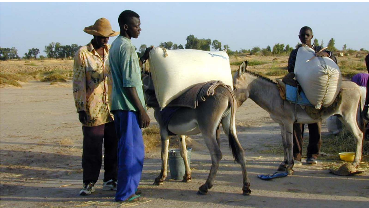
Bild 7: Junge Männer haben die Säcke am Dreschplatz gefüllt, zugenäht und transportieren diese ins Dorf

Ausnahmen bestätigen die Regeln: Die traditionellen Arbeiten der Frau oder des Mannes können vom jeweilig anderen Geschlecht (mit)erledigt werden, aber niemals, ohne dass jemand vom eigentlich „zuständigen“ Geschlecht dabei ist. Beispiel: Männer dürfen dreschen, aber nicht ohne Frauen. Den Frauen vorbehalten sind der Transport der Ähren zum Dreschplatz und das Wörfeln. Ausschließliche Männerarbeiten sind das Aufhacken des Bodens, das Füllen der Reissäcke und deren Transport ins Dorf. „Bei manchen Arbeiten gibt es keine Wahl. Und wenn Du keine Frau hast, die die Arbeiten für Dich erledigt, dann fragst Du Deine Schwester, Deine Mutter oder eine andere Verwandte. Die