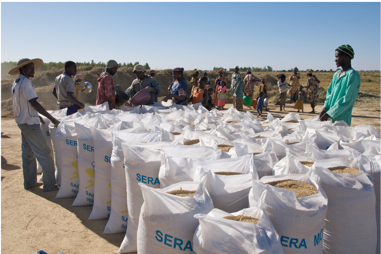
Ernte am Bara Issa, Dezember 2009